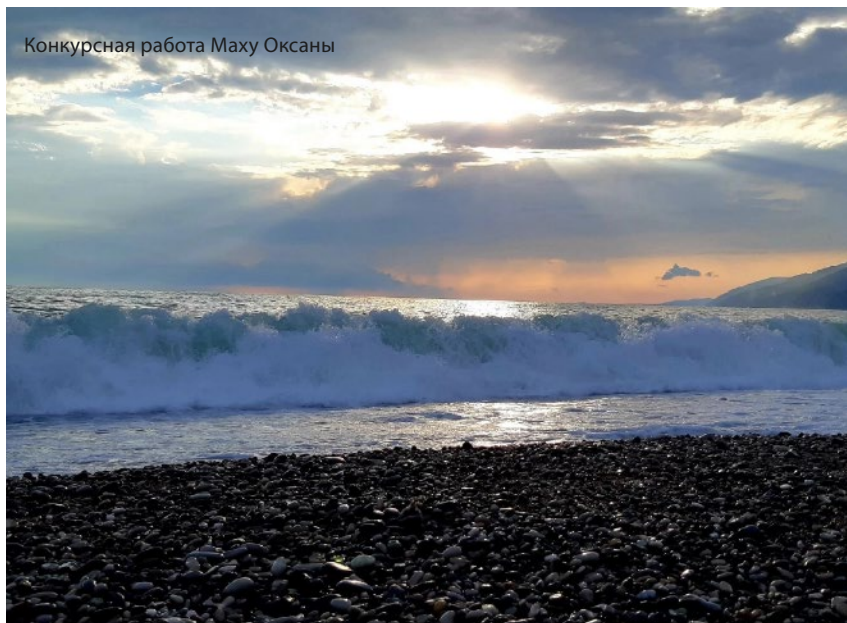
Конкурсная работа Маху Оксаны