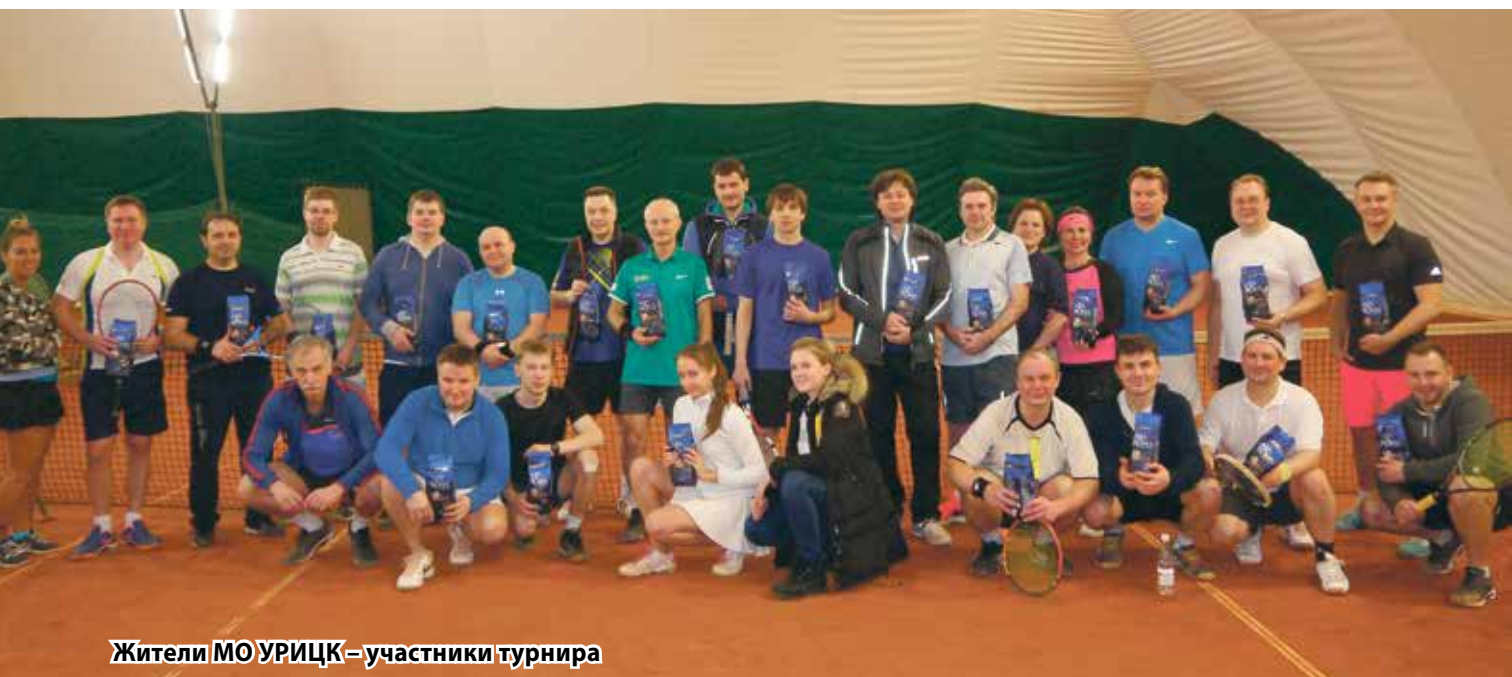
Жители МО УРИЦК – участники турнира

Победителям и призерам соревнований вручили медали и почетные грамоты. Компания «Алмафуд»