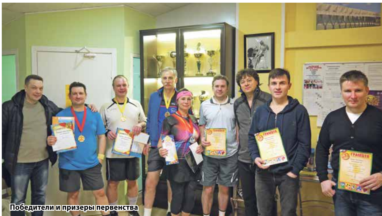
Победители и призеры первенства

премировала каждого участника и помощника в организации турнира пачкой ароматного зернового кофе Alta Roma.