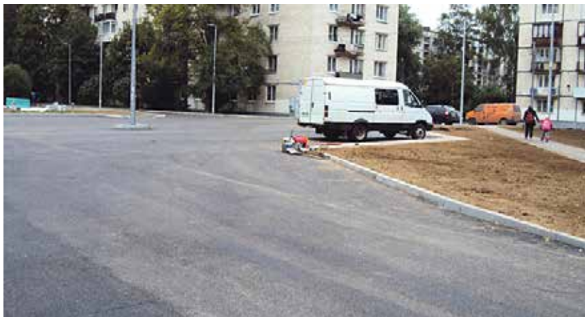
После реконструкции асфальтового покрытия у дома № 12 по ул. Партизана Германа

Проблему устраняла Местная администрация МО УРИЦК. На внутриквартальной территории у домов № 10, корп. 4, № 12 по ул. Партизана