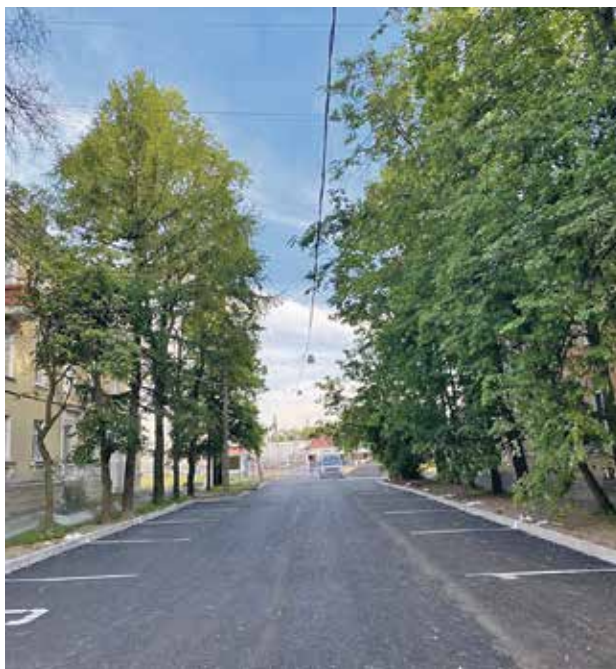
пр. Народного Ополчения, 211–213

К сожалению, пока одни ремонтируют и благоустраивают, другие – ломают. В этом году пришлось заниматься ремонтом малых архитектурных форм. Это хорошо знакомые жителям Почтальон Печкин, стоящий возле