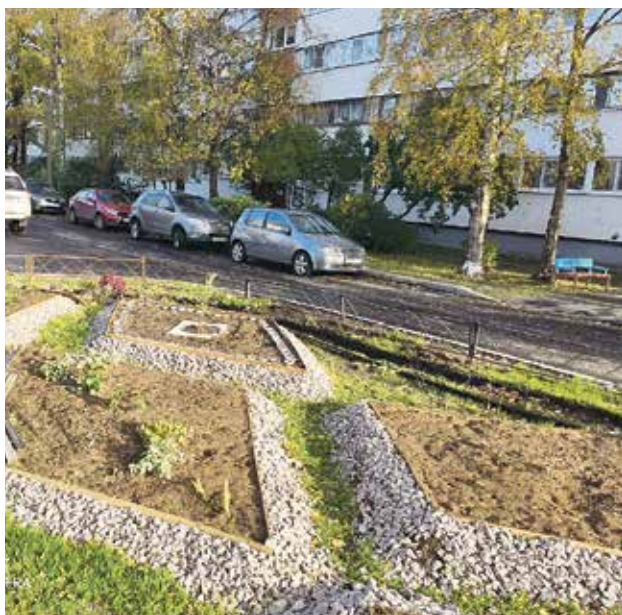
Здесь будет «Сад цветов»

Во время городского месячника по благоустройству прошел субботник, в котором приняли участие депутаты Муниципального Совета и сотрудники Местной администрации МО УРИЦК, а также многие жители. Они высаживали деревья, убирали территорию вблизи жилых домов.