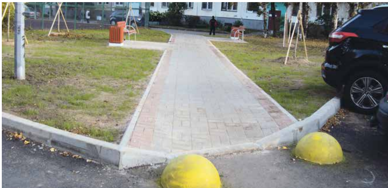
ул. Авангардная, 23

Тем не менее, большинство наших соседей стараются созидать, а не разрушать.