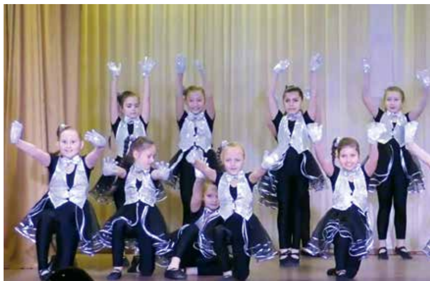
Студия эстрадно-спортивного танца «Полет»

В каждой номинации юным дарованиям присваивались звания дипломантов I, II, III степеней. Но, по словам членов жюри, проигравших в этом конкурсе не было – все работы фестиваля «Радуга УРИЦКА» заслуживали самых высоких оценок и искренних похвал.