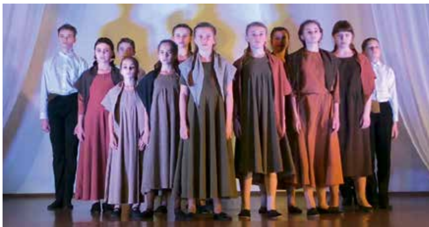
Детский театр «Алиса»

Главной «изюминкой» нашего конкурса традиционно является широкий круг номинаций. Это и вокальное творчество, и инструментальное исполнение, танцы, цирковое искусство и работы в формате видеороликов.