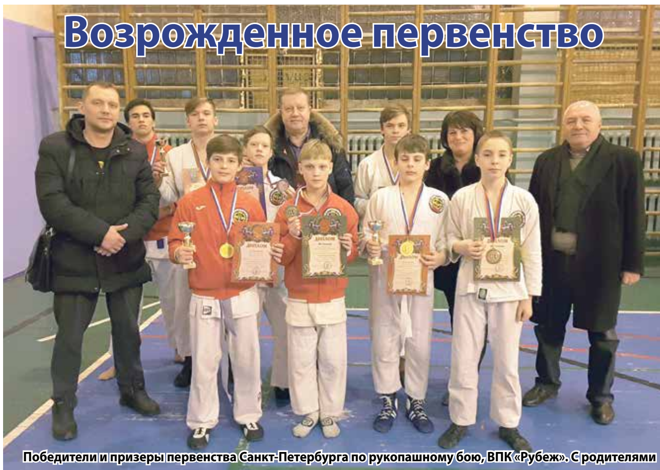
Победители и призеры первенства Санкт-Петербурга по рукопашному бою, ВПК «Рубеж». С родителями

В марте команда спортсменов-рукопашников УРИЦКА успешно выступила на Первенстве и Кубке Санкт-Петербурга по рукопашному бою.